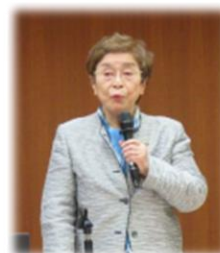
福祉学者・社会学者 元京都精華大学、安 田女子大学、松山大 学教授。 「百まで生きる覚 悟」など著書多数。